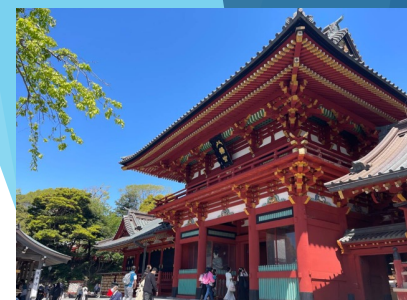
鶴岡八幡宮を風祭東と参拝・御祈祷