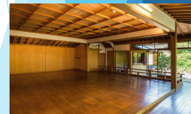
能楽堂トークショー・ミニライブ会場